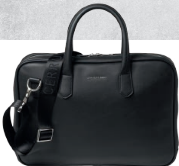
NTL 914 A

Sacoche cuir pour ordinateur portable est faite d'un matériau noir lisse et léger avec une signature en métal chromé brillant.